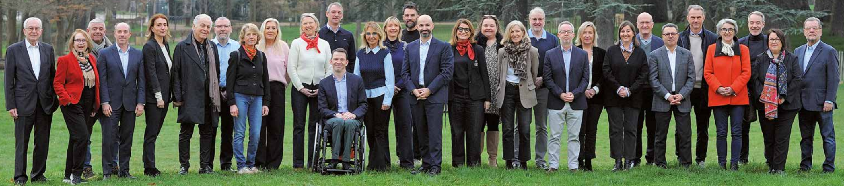
LISTE DES CANDIDATS - de gauche à droite sur l'image